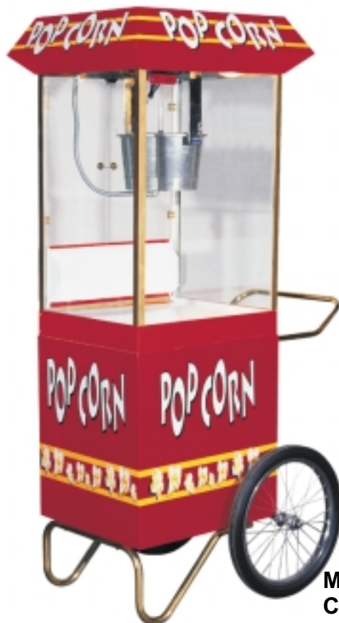
Modelo MPLA Carrito opcional