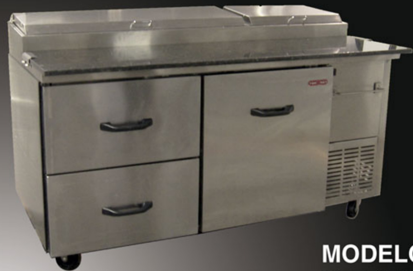
MODELO PTP 170-21