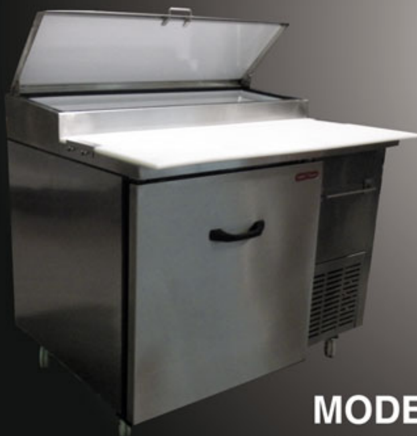
MODELO PTP 112-10