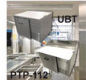
UBT Mesas frías de 1.12 mts.