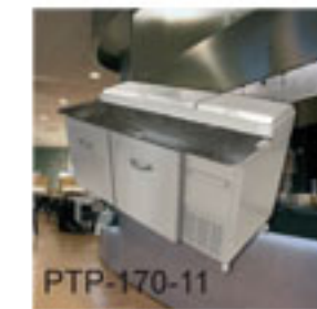
PTP-170-11 Mesa fría de 1.70 mts.

Cuenta con una amplia mesa de trabajo para facilitar la preparación de alimentos. Construida en Granito la cual brinda higiene y versatilidad, además como es desmontable facilita la limpieza. La medida de la mesa es de 171 cm x 49 cm.