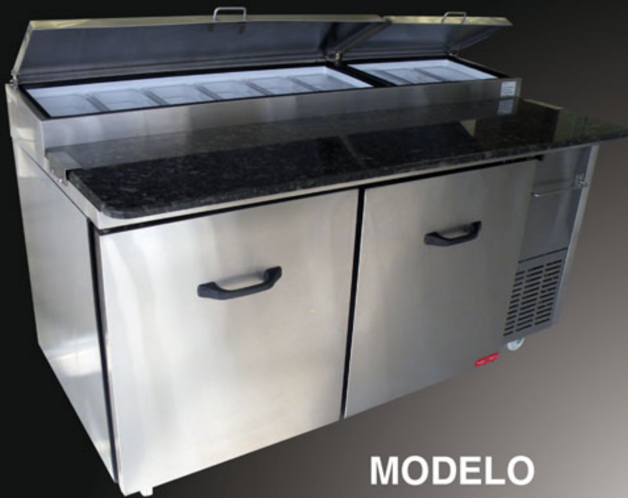
MODELO PTP 170-11